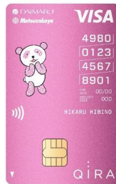
さくらパンダカード