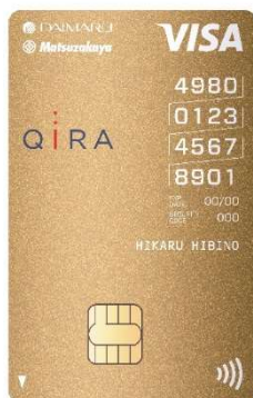
大丸松坂屋 ゴールドカード