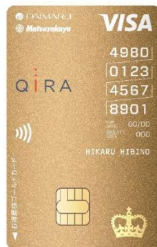
大丸松坂屋 お得意様ゴールドカード