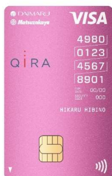
大丸松坂屋カード

・これまでの横型の大丸松坂屋カードから大きくデザインのリニューアルを行いました。業界初となる縦型のカードデザインは Visa のタッチ決済も導入し、カード番号も4桁4段の分かりやすい表記を採用したほか、カードカラーもシンプルで上質さを感じる色合いを目指しました。